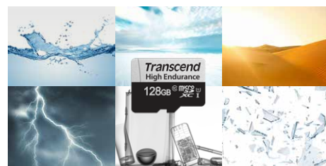
通過極端環境測試