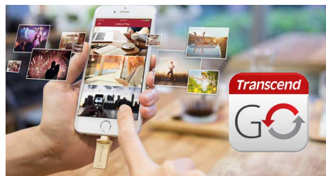
搭配專屬JetDrive Go App

創見JetDrive™ Go 500 Lightning/USB 3.1隨身碟專為iPhone®、iPad®及iPod®所設計，不僅提供最高128GB的儲存空間，更採用鋅合金外殼，優雅呈現時尚的流線造型。搭配創見專屬JetDrive Go App，JetDrive Go 500不再只是一只隨身碟，它能做的比你想像得多更多！